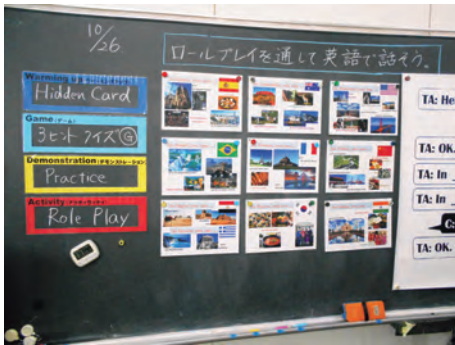
教材・教具を使って