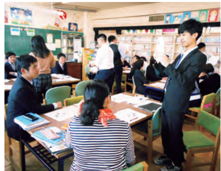
研修7 教材・教具の効果的な活用について

研究協力校で実際に行った研修では、研究授業後、「教材・教具の効果的な活用について」の研修を15分実施しました。授業で使用した教材の説明を受け、グループで演習を行いました。また、授業でどのように活用しているのか、活用できそうか、情報交換の場をもちました。